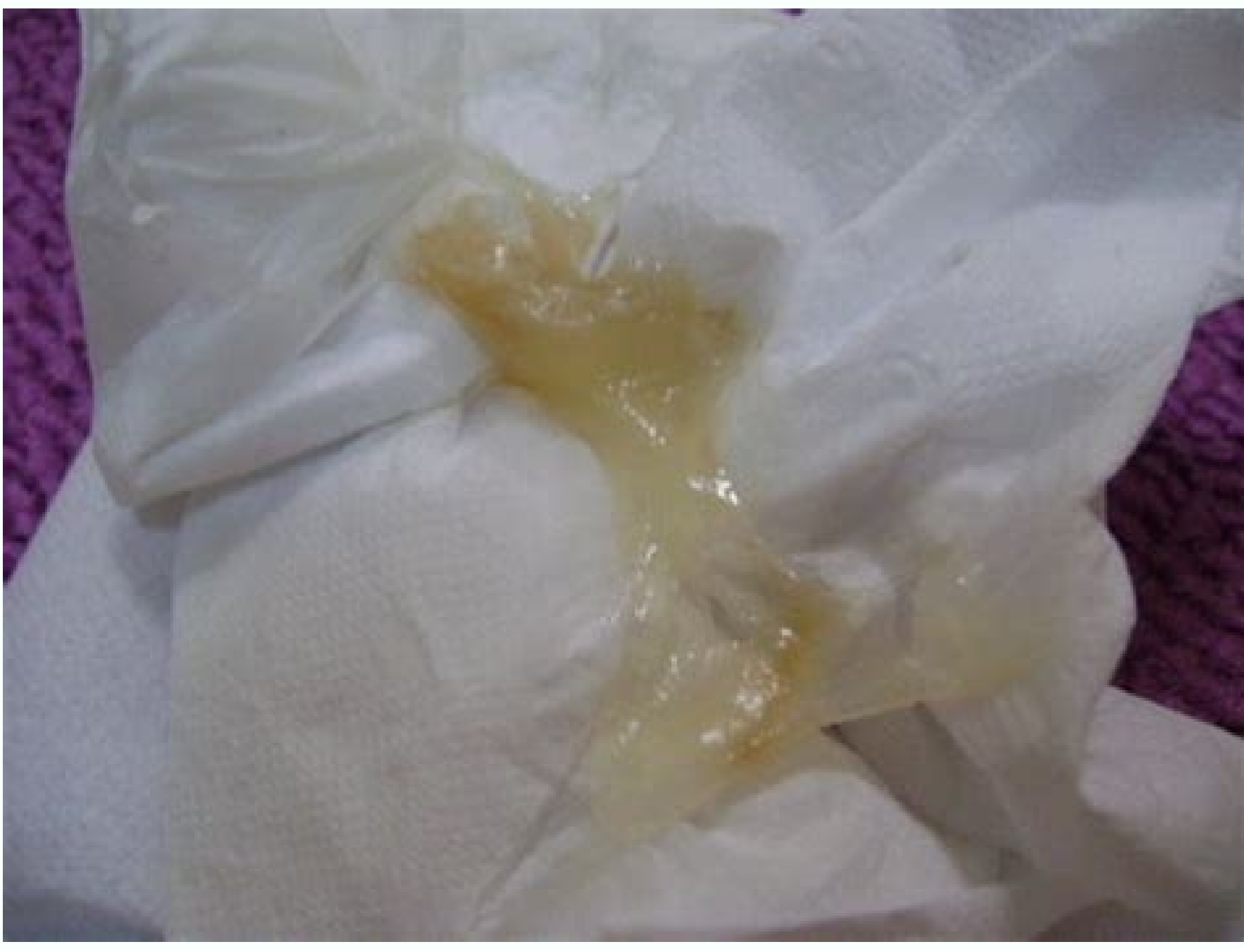
Fezes com sangue bebe 1 mês